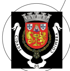
Ranking Regional - Centro