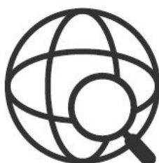
Variável 2 PROCURA ONLINE