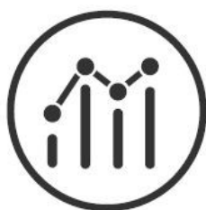
Variável 1 DADOS ESTATÍSTICOS