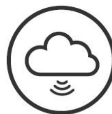
Variável 3 DESEMPENHO ONLINE

O Portugal City Brand Ranking ® é um estudo anual desenvolvido pela Bloom Consulting , baseado num algoritmo proprietário, que considera diversas fontes de informação relacionadas com as três dimensões analisadas: Negócios, Visitar e Viver. Os resultados finais deste ranking analisam as perceções sobre um concelho, classificam o seu desempenho de uma forma tangível e realista e medem o sucesso da marca de cada um dos 308 municípios portugueses.